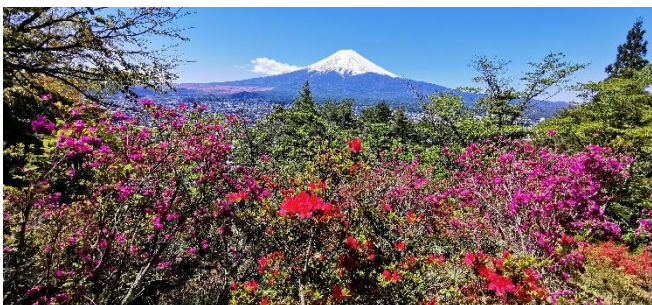
Azaleen-Blüte am Mt. Fuji

Fr 19.04.24 / 9. Erlebnis-Tag: Heute kommen alle Teilnehmer(innen), die sich an Blüten und Pflanzen erfreuen, voll auf ihre Kosten. Mit dem Zug fahren wir durch eine wunderbare Landschaft zum Ashikaga Flower Park . Dieser Park ist berühmt durch einzigartige Wisteria-Bestände. Die dortigen „Blauregen“-Pflanzen (auch noch „Glyzinien“ genannt) sind teilweise über 100 Jahre alt, die bis zu 1,80 m langen Blüten-Kaskaden leuchten in Blau- und Violett-Farben. Aber auch weiße Wisteria-Blüten sind zu bewundern. Der Park hat noch viele andere Pflanzen zu bieten – Sie werden immer wieder neue Fotomotive finden.... Zutiefst beeindruckt von dem heutigen Farben-Spektakel fahren wir zurück nach Tokyo und übernachten im Stadtviertel Ginza.