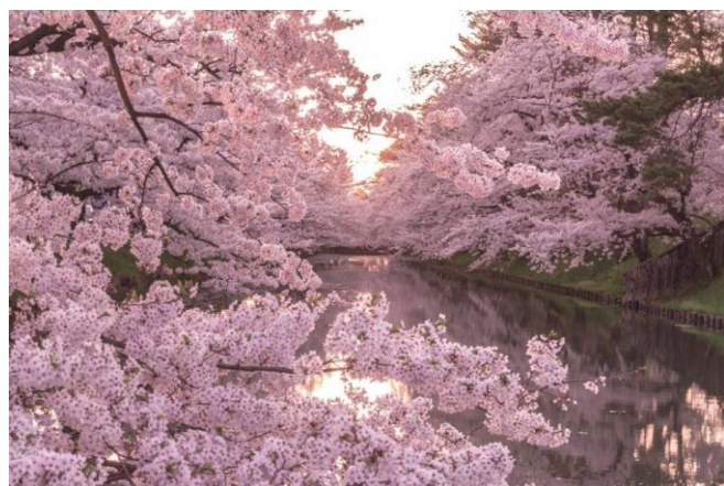
Hinohina River in Kakunodate / Akita: