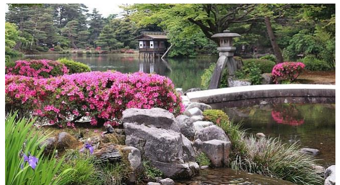
Korakuen Garten Okayama