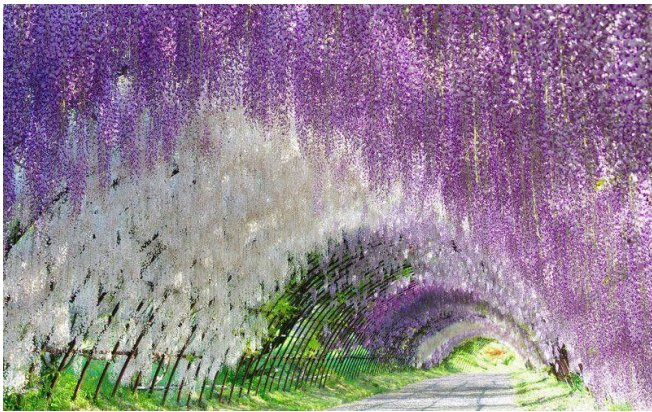
Wisteria - Tunnel im Ashikaga Park