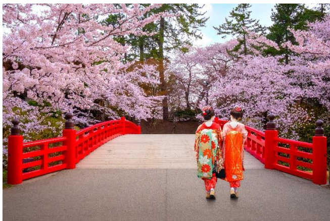
Hirosaki Castle Park