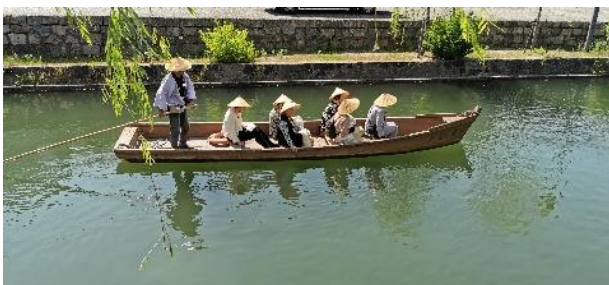
Bootstouren in Kurashiki

Di 23.04.24 / 13. Erlebnis-Tag: / Okayama und Kurashiki Zunächst fahren wir mit dem Shinkansen in ca. 90 Minuten nonstop von Kyoto nach Okayama. Hier besuchen wir einen der drei schönsten japanischen Gärten des Landes: den Korakuen Garten . Im Frühjahr zählen Azaleen- und Pfingstrosenblüte zu den Attraktionen im Park. Anschließend fahren wir in nur 17 Minuten von Okayama nach Kurashiki . Die Handelsstadt war in der Edo Zeit (1603 bis 1867) ein wichtiges Verteilzentrum für Reis; entlang des Kanals befindet sich das alte „Bikan“-Viertel: es bietet unzählige Fotomotive. Fakultativ können Sie auch noch das berühmte Ohara Kunst-Museum anschauen, welches bereits 1930 von dem örtlichen Kaufmann und Mäzen Ohara Magosaburo errichtet wurde und Werke u.a. von Picasso, El Greco, Gauguin, Modigliani, Rodin, Klee, Pollock und Kandinsky beherbergt. Übern. in Kyoto.