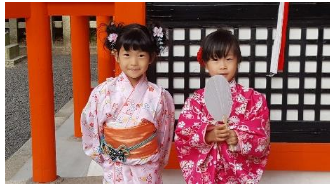
Mädchen in Kimonos am Inari Schrein

Mt.Fuji. Nach Ankunft in Kyoto checken wir in unserem Hotel in unmittelbarer Bahnhofsnahe ein. Am Nachmittag hat der stadtnahe Fushimi Inari-Schrein die besten Lichtverhältnisse zum Fotografieren. Der Schrein mit seiner kilometerlangen Tori-Galerie wurde durch den Film „Die Geisha“ weltberühmt. Sie können hier hunderte von Besucherinnen in farbenprächtige Kimonos fotografieren.