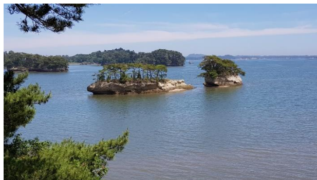
Kiefer-Inseln vor Matsushima

Mi 17.04.24 / 7. Erlebnis-Tag: auch heute bewundern wir die schönsten Kirschblüten-Plätze von Tōhoku. Übernachtung in Morioka. Die 2 Übernachtungen in Morioka (eine Großstadt mit 300 000 Einwohnern und entsprechend großem Restaurant-Angebot) geben uns die Möglichkeit, auch abends die Kirschblüten zu bewundern – die besonders beliebten Plätze werden mit Lampions oder Lampen illuminiert – ein ganz besonderes Erlebnis.