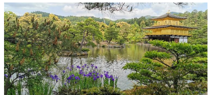
Der Goldene Pavillon in Kyoto

So 22.04.24 / 12. Erlebnis-Tag: Stadtbesichtigung in Kyoto mit Ihrer Atlantis-Reiseleitung. Über 1000 Jahre lang war Kyoto die Hauptstadt des Kaiserreiches. Die Stadt Kyoto bietet 1600 buddhistische Tempel, 400 shintoistische Schreine und allein 17 Stätten mit dem Prädikat „UNESCO-Weltkulturerbe“. Sie erhalten von uns eine Tageskarte für das Bus-Netz von Kyoto mit unbegrenzter Nutzung am heutigen Tag.