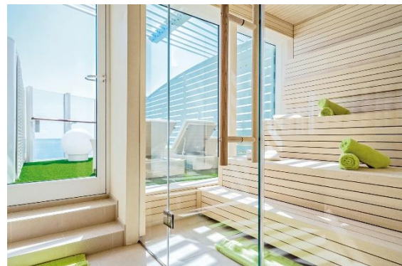
... Sauna AIDAprima...